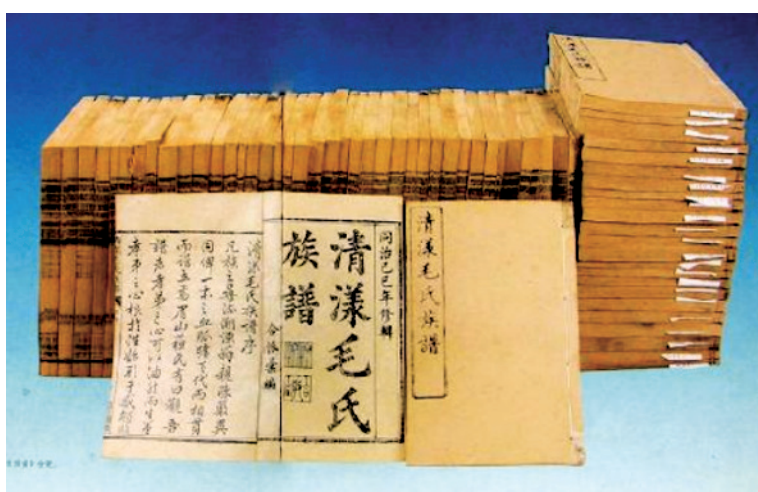
Ryc. 2. Księga rodowa założyciela Chińskiej Republiki Ludowej – Mao Tse-tunga (chiń. Mao Zedong, 1893–1976 r.).

Należy dodać, że zdecydowana większość zapisów genealogicznych w Chinach występuje właśnie w postaci ksiąg, rzadziej w formie drzew genealogicznych, rozpowszechnionych w Europie. Główna tego przyczyna jest chyba oczywista – przy sięgających tak daleko wstecz dziejach danego rodu zapis książkowy jest o wiele bardziej praktyczny. Natomiast drzewa rysuje się wtedy, gdy na przykład chińska rodzina chce przeanalizować pochodzenie swoich przodków tylko w obrębie kilku ostatnich pokoleń.