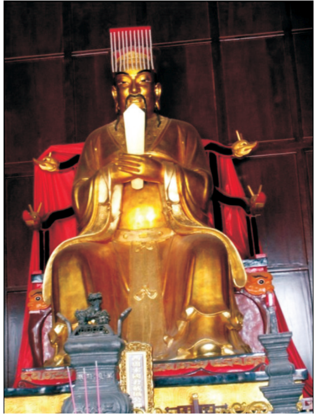
Ryc. 8. Założyciel rodu Dai – książę Song Daigong (宋戴公) (824–766 r. p.n.e.).