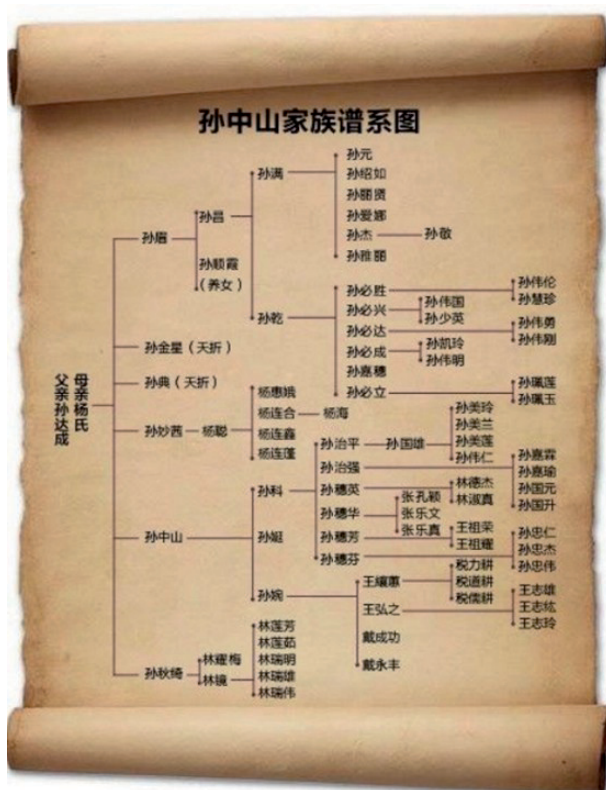
Ryc. 6. Drzewo rodowe założyciela Republiki Chińskiej – Sun Yat-sena (chiń. Sun Zhongshan, 1866–1925 r.).