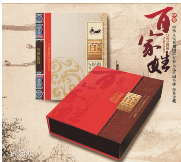
Ryc. 7. Dzieło 百家姓 (bǎi jiā xìng), czyli Chińskie nazwiska.

kim dwie prowincje wschodnich Chin: Jiangsu i Zhejiang. Pod względem powszechności to nazwisko znajduje się na 57. miejscu wśród nazwisk w Chinach kontynentalnych i na 50. miejscu na Tajwanie. Trzeba też dodać, że według niektórych danych wszystkich nazwisk w Chinach jest ponad 5600.