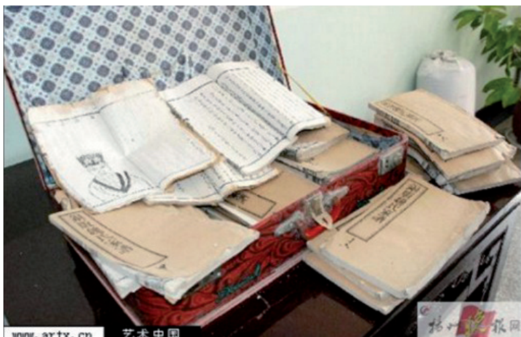
Ryc. 1. Przykład zbioru chińskich ksiąg rodowych.