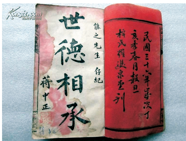
Ryc. 4. Księga rodowa założyciela Republiki Chińskiej na Tajwanie – Czang Kaj-szeka (chiń. Jiang Jieshi, 1887–1975 r.).

wincje Chin (powyżej 8% ogólnej liczby mieszkańców), w mniejszej ilości południową (poniżej 8%); najrzadziej to nazwisko spotyka się na południowo-wschodnim wybrzeżu kraju;